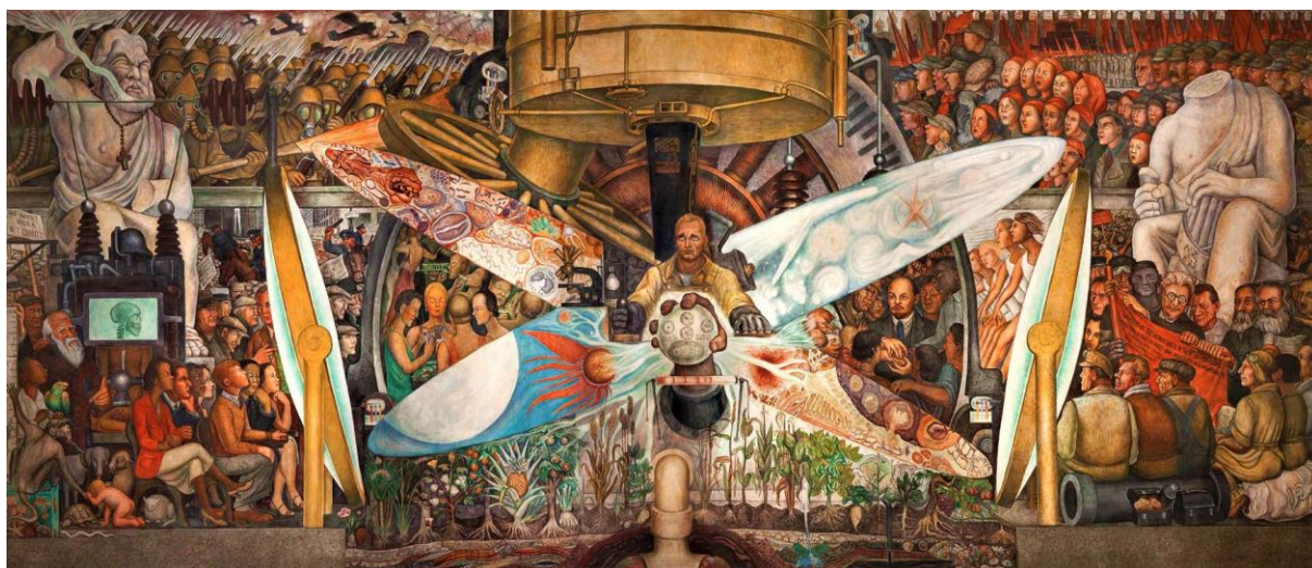
фреска мексиканского художника Диего Риверы «Человек, управляющий Вселенной» (1934 год) на стене Дворца изящных искусств в Мехико

21 апреля 2022, 26 апреля 2022, 16 мая 2022