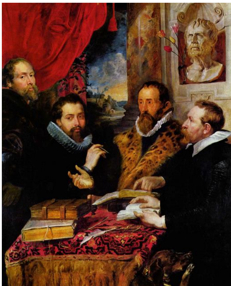
Питер Пауль Рубенс «Четыре философа» (1611–1612 гг.)